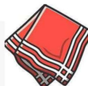
Une serviette de table