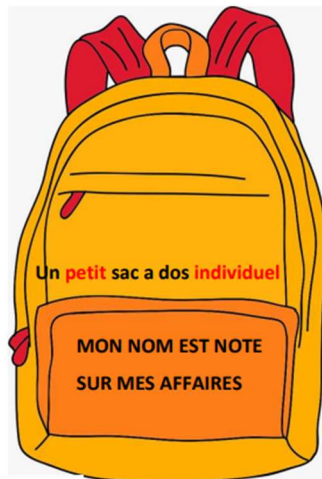
Un petit sac a dos individuel